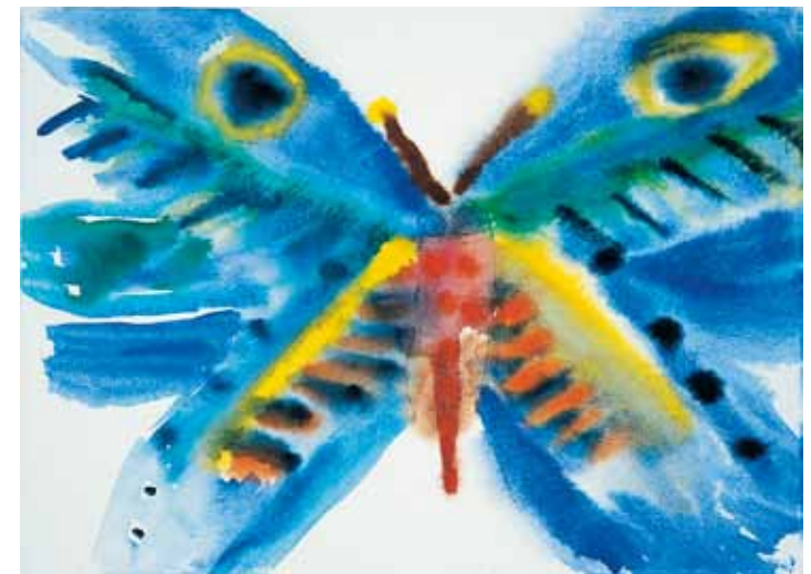
„Schmetterlinge 1“ – Mädchen, 12 Jahre

„Schön“, flüstert Mama und schmunzelt. „Aber jetzt schläft und träumt was Schönes!“