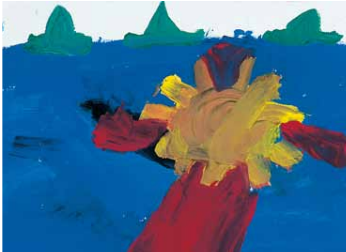
„Spiegelung des Sonnenuntergangs am Meer mit drei Segelbooten“ – Mädchen, 9 Jahre

Niemand kann ständig auf Hochtouren laufen; auch der leistungsfähigste Mensch hat seine Grenzen und braucht Erholungszeiten, in denen er abschalten und neue Energie tanken kann. Einige entspannen sich, indem sie sich körperlich betätigen: Sie treiben Sport, machen Spaziergänge oder arbeiten in Haus und Garten. Andere wiederum hören lieber Musik, lesen ein Buch oder gehen in die Sauna.