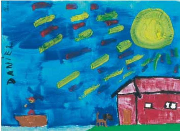
„Kleiner Mann geht mit dem Boot auf Reise“ – Junge, 8 Jahre

Mancher Kranke lebt im Gegensatz dazu lieber von einem Tag auf den anderen. Vielleicht möchte er auf diese Weise die Wirklichkeit ein bisschen von sich fern halten.