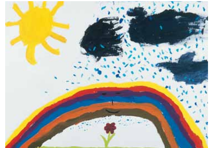
„Der Regenbogen beschützt die kleine Blume, Gewitterwolken ziehen von links nach rechts vorüber“ – Mädchen, 11 Jahre

Erklären Sie Ihrem Kind deshalb alles in wenigen, kurzen und einfachen Sätzen.