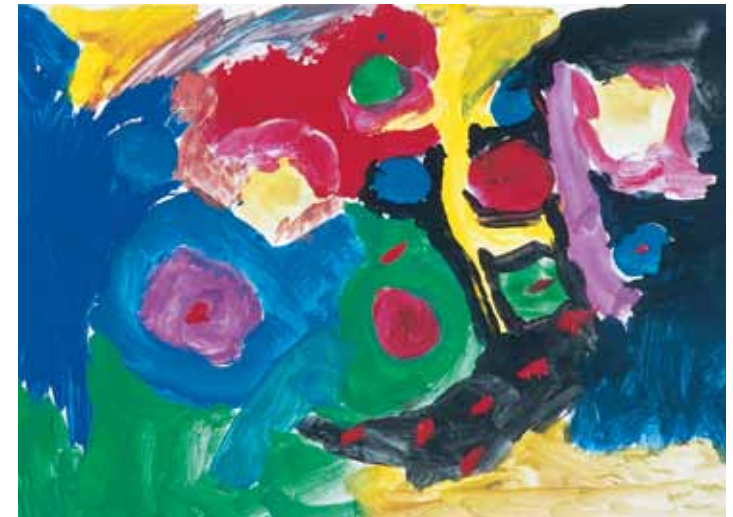
„Zellen 2“ – Mädchen, 8 Jahre