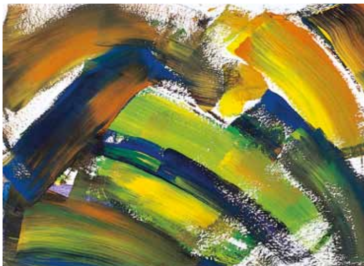
„Der zerbrochene Regenbogen“ – Mädchen, 14 Jahre

Kleinere Kinder zeigen dem Kranken ihre Zuneigung und Fürsorge gern durch selbstgemalte Bilder, Bastelarbeiten oder Blumen. Sie haben dadurch das Gefühl, ein gleichwertiges Mitglied der Familie zu sein. Vielleicht möchten ältere Kinder dem Kranken lieber etwas vorlesen, sich mit ihm an gemeinsame Ferien oder besondere Ereignisse erinnern oder den Erwachsenen bei der Pflege des Kranken helfen.