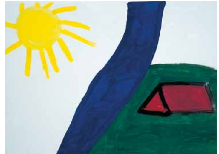
„Zelt am Fluss auf einer Wiese, links scheint die Sonne“ – Mädchen, 9 Jahre

Versuchen Sie, eine Lösung zu finden, mit der alle leben können: die die besonderen Bedürfnisse des Kranken berücksichtigt, die gleichzeitig aber auch einen reibungslos funktionierenden Alltag gewährleistet. Stellen Sie sich darauf ein, dass es einige Zeit dauern wird, bis sich dieses Gleichgewicht einstellt. Alte Muster lassen sich nur schwer verändern.