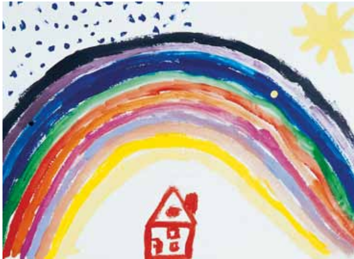
„Kleines Haus unterm Regenbogen“ – Junge, 8 Jahre

Sprechen Sie daher ganz offen und möglichst bald mit Ihrem Kind. Wenn Sie so lange warten, bis es die Wahrheit aus anderer Quelle erfahren hat, geht ein Stück Vertrauen verloren. Dann wagt das Kind womöglich selbst auch nicht, Sie offen zu fragen, und bleibt mit seinem Kummer allein.